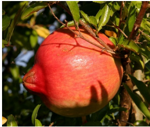
ԼՐԱՏՈՒ ՀՈՒԼԻՄ 2013