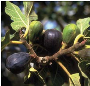
«Շուկաներ Մեղրիի համար»